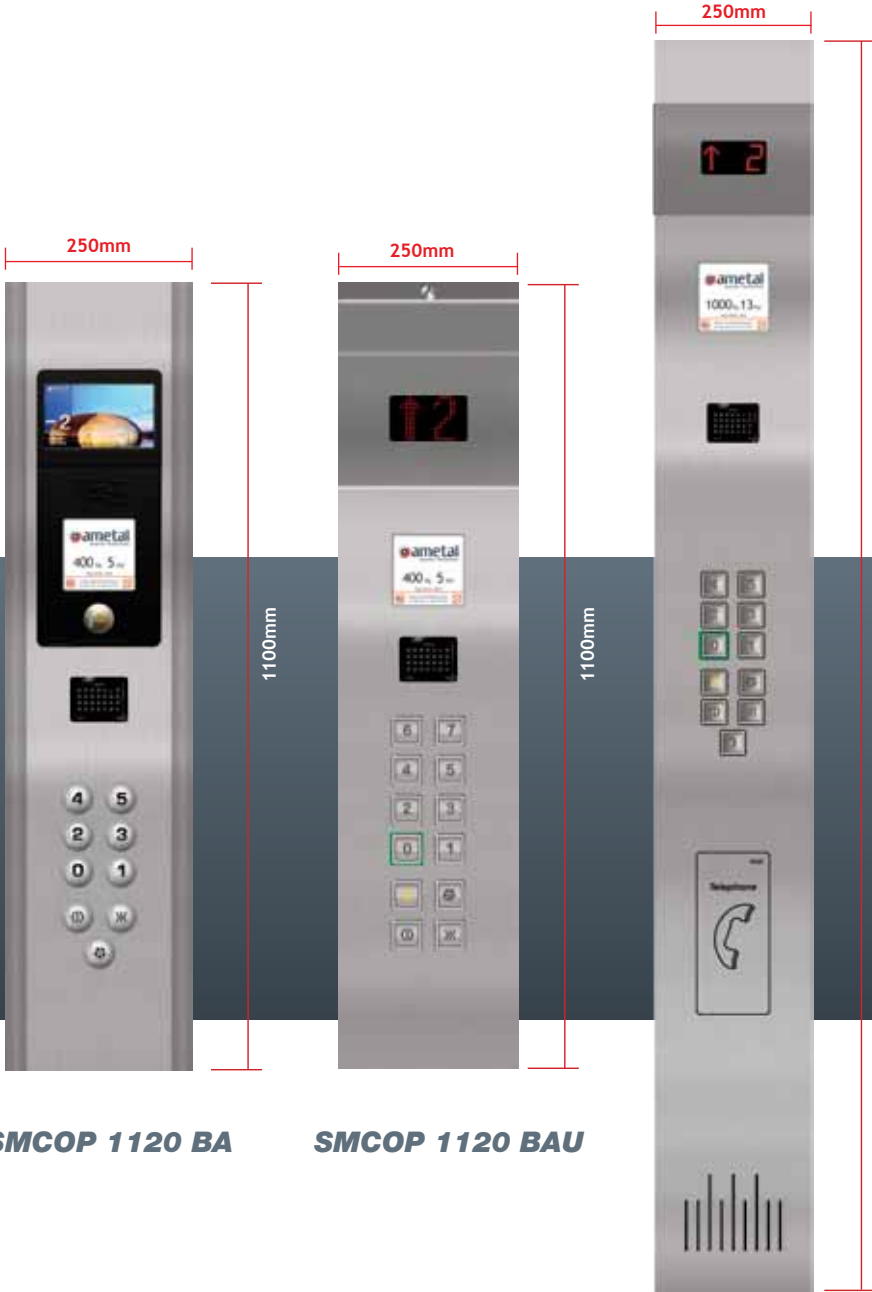
SMCOP 1120 BA