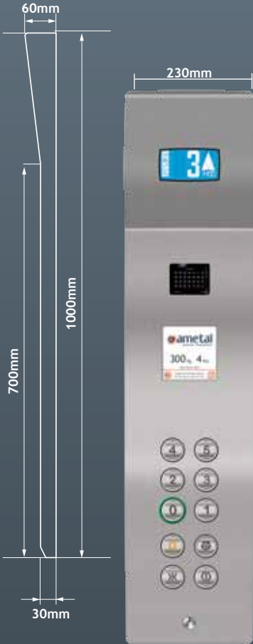
SMCOP 1120 BAUT